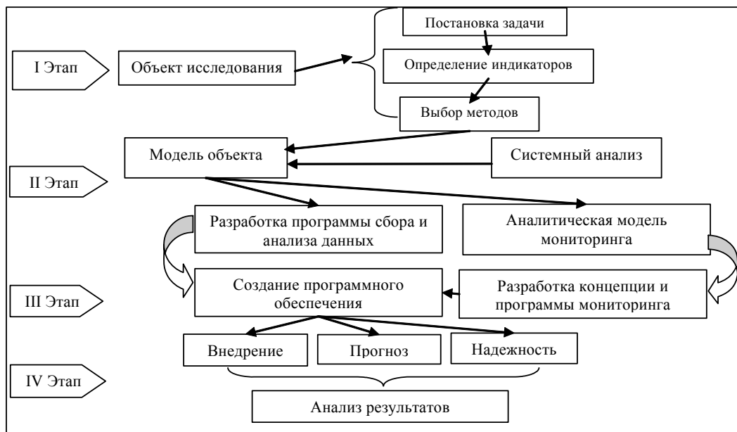
Рис. 3. Структурная схема алгоритмов мониторинговых исследований

Создание информационных систем совместно с моделированием социально-экономического положения регионов дает возможность не только статистической оценки состояния объекта (процесса) исследования, но и наглядное предоставление результатов исследования в виде компьютерных тематических карт. Данный подход может использоваться не только как способ фиксации наблюдения и исследования территориальных явлений (процессов), но также в качестве рабочего материала для дальнейшего анализа.