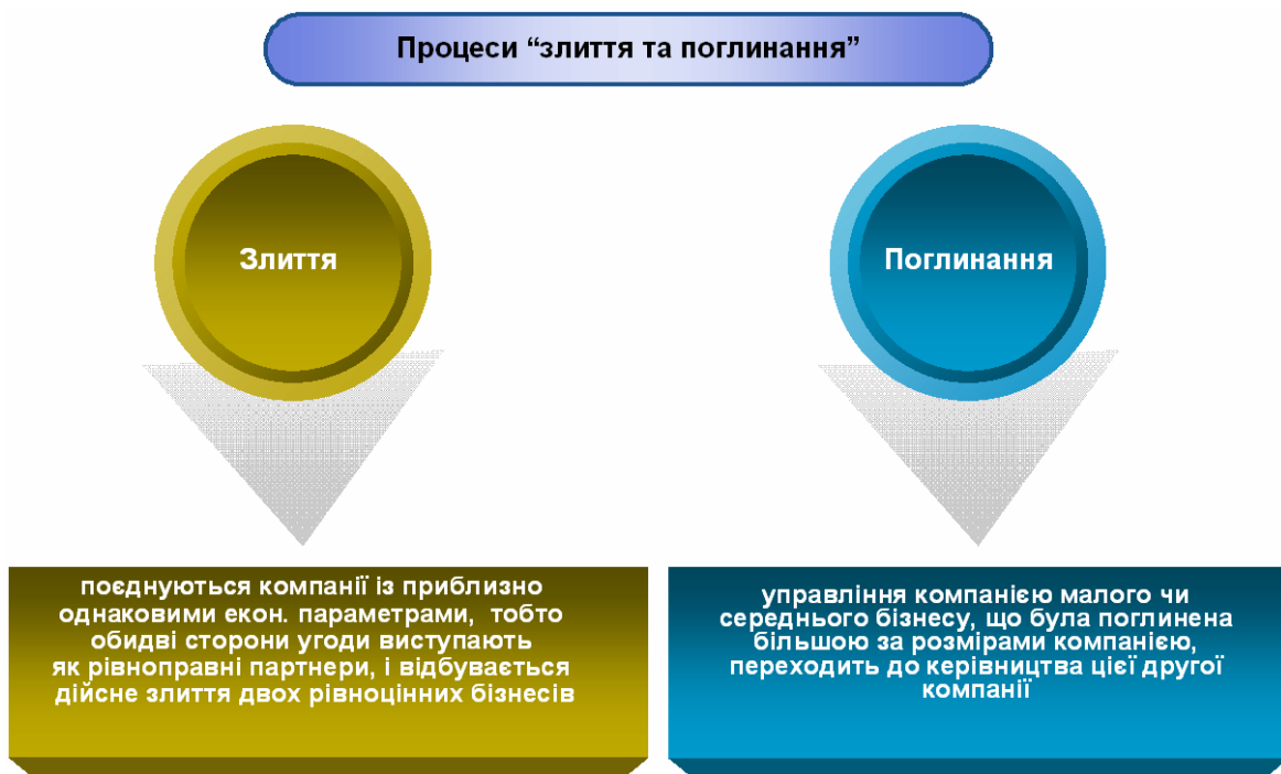
Рис. 2. Характеристика процесів «злиття» та «поглинання»

У другому випадку в ст. 126 ГК України використовується термін "вирішальна залежність асоційованих підприємств", де під асоційованими підприємствами розуміється "група суб’єктів господарювання — юридичних осіб, пов’язаних між собою відносинами економічної й/або організаційної залежності у формі участі в статутному фонді й/або управлінні". При цьому "суб’єкт господарювання, що володіє контрольним пакетом акцій дочірнього підприємства (підприємств), визнається холдинговою компанією" [2]. Таким чином, при поглинанні управління компанією, що була поглинена більшою (чи такою, що працює більш ефективно), переходить до керівництва цієї другої компанії (рис. 2).