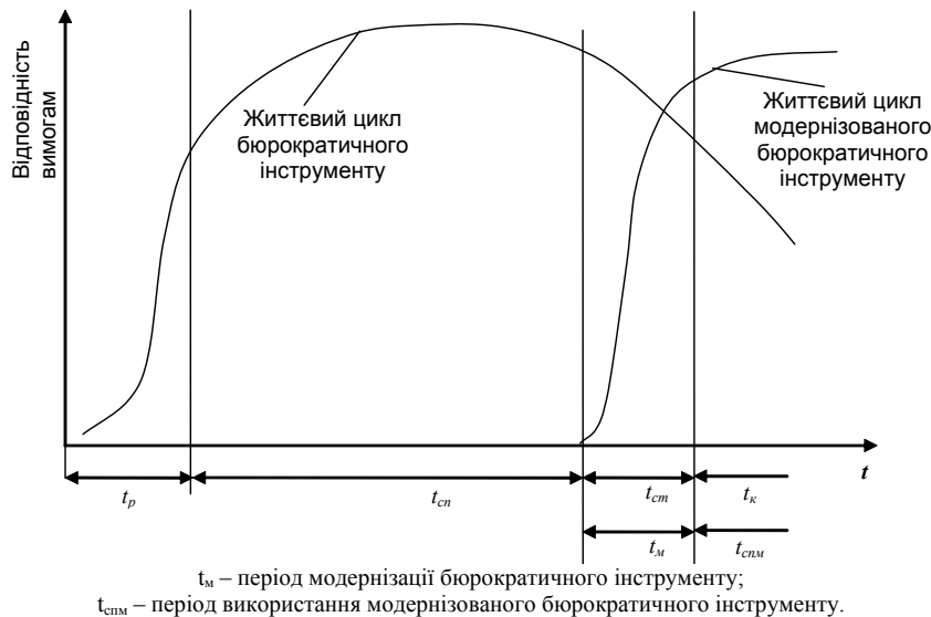
Рис. 2. Графік життєвого циклу бюрократичного інструменту при його модернізації

Використання поняття життєвого циклу щодо бюрократичного інструменту потребує визначення його тривалості та структури за часовими періодами. Середнє значення часових параметрів життєвого циклу бюрократичних інструментів за їх групами встановлено на підставі результатів відповідного дослідження по аналізованих підприємствах.