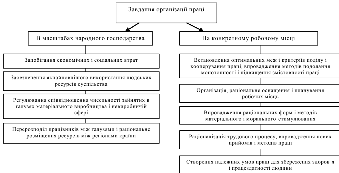
Рис. 2. Завдання організації праці

В масштабах народного господарства та на конкретному робочому місці вирішуються такі завдання організації праці, які зображуються на рис. 2.