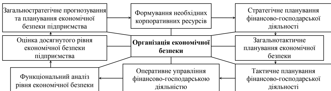
Рис. 1. Схема процедури організації економічної безпеки підприємства

Загальна схема процесу організації економічної безпеки зображена на рис. 1.