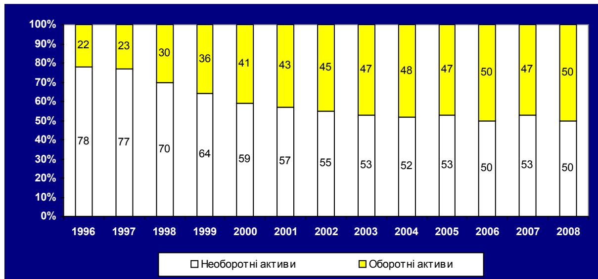
Рис. 2. Динаміка обсягів активів підприємств України в 1996 – 2008 рр. (%)

Тому оптимізація структури необоротних та оборотних активів вимагає врахування галузевих особливостей, тривалості операційного циклу підприємства, врахування оцінки позитивних та негативних особливостей функціонування цих активів.