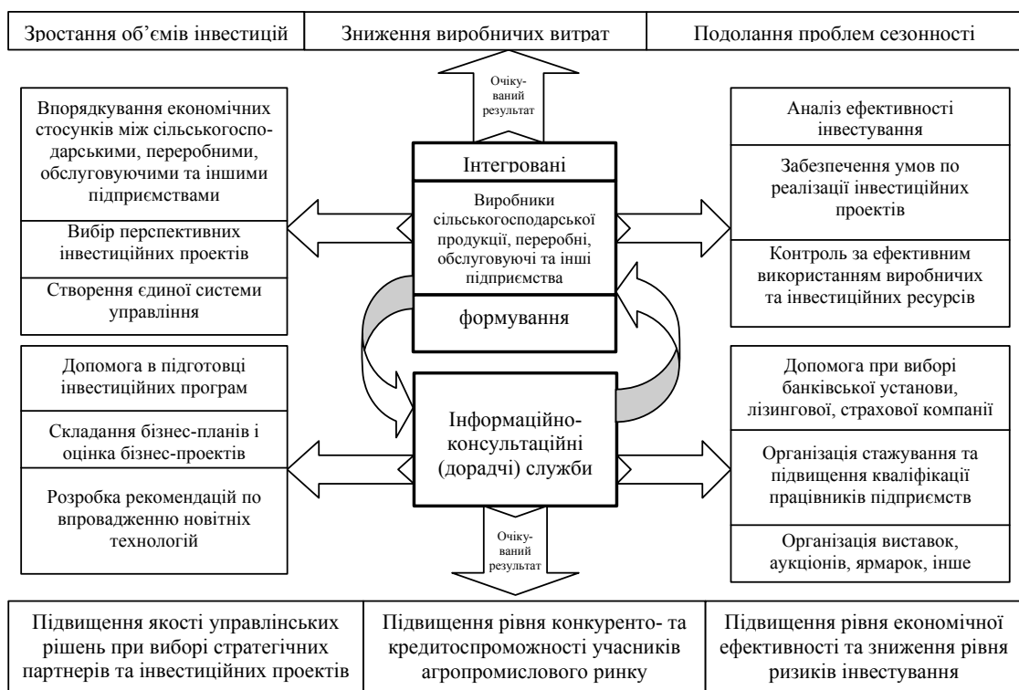
Рис. 2. Схема підвищення інвестиційної привабливості через взаємодію інтегрованих формувань та інформаційно-консультаційних служб

Ефект від формування та розвитку інтегрованих формувань і інформаційно-консультаційних служб їх взаємозв'язку можна спостерігати на рис. 2.