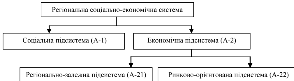
Рис. 1. Структура регіональної соціально-економічної системи

В кожному регіоні необхідно вирішувати як соціальні, так і економічні завдання, тому на першому рівні декомпозиції відповідно до них проведено поділ системи (А) на дві взаємозалежні підсистеми: соціальну (А-1) та економічну (А-2), що проходяться у взаємодії та взаємовпливі. Відповідно до цих умов на другому рівні декомпозиції виокремлено дві підсистеми [8, с. 40]: регіонально-залежну (А-21) та ринково-орієнтовану (А-22), (рис. 1). Результатом такого поділу стало визначення структури регіональної соціально-економічної системи, складові якої мають різні завдання та умови функціонування.