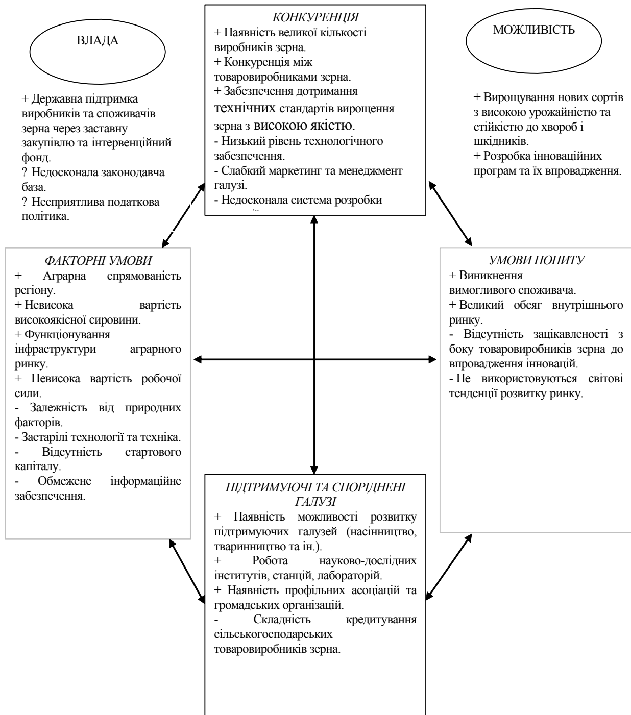
Рис. 2. Модель управління факторами конкурентоспроможності ринку зернових

Відповідно для України державне регулювання ринку зерна для забезпечення факторів конкурентоспроможності на ринку має спрямовуватися на: