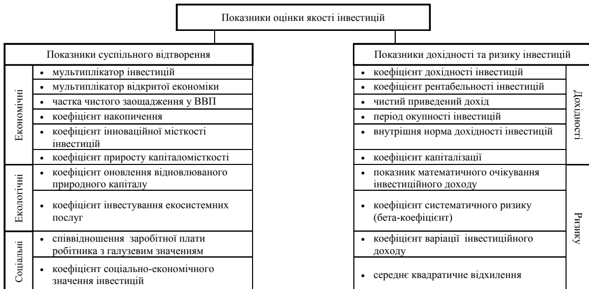
Рис. 3. Показники оцінки якості інвестицій

В основу формування оціночних показників третього блоку (табл. 3) покладено принцип двокритеріальної концепції якості інвестицій. Така позиція дозволяє виокремити дві глобальні групи показників оцінки якості інвестицій – суспільного відтворення та дохідності – і окреслити напрямки їх диференціації.