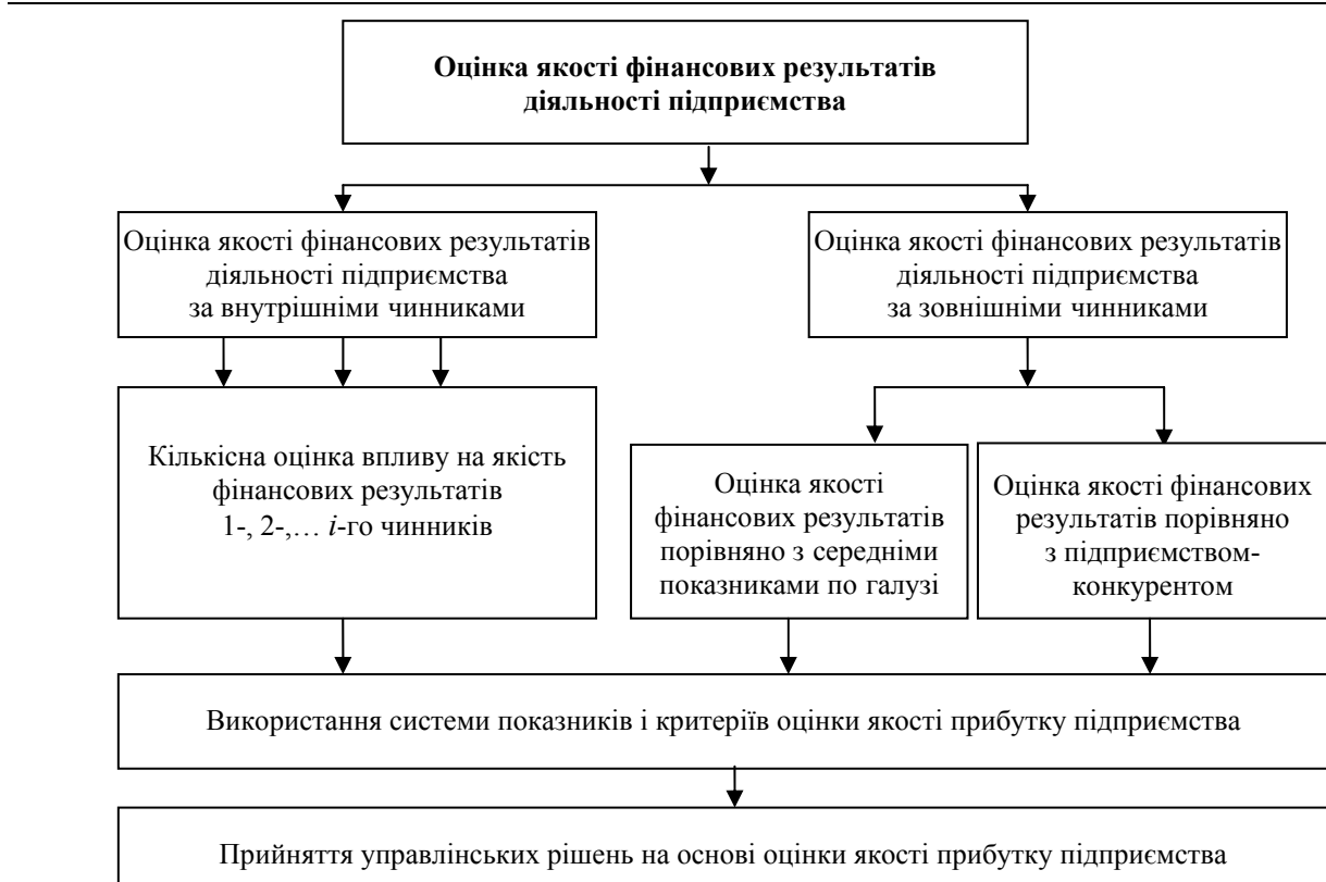
Рис. 2. Схема оцінки якості фінансового результату підприємства з позиції врахування впливу зовнішніх і внутрішніх чинників, що впливають на результати діяльності підприємства

Висновки. Запропоновані в роботі теоретико-методичні підходи щодо удосконалення оцінки розвитку підприємства та оцінки якості фінансового результату дозволяють більш системно і ґрунтовно розкривати сутність золотого правила економіки підприємства і враховувати при цьому окремі (або у сукупності) специфічні особливості його розвитку, наприклад, умови і специфіку фінансової діяльності підприємства.