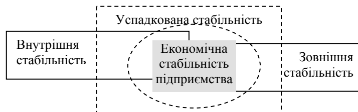
Рис. 1. Економічна стабільність підприємства [1, с. 84]

В основі досягнення внутрішньої стабільності лежить принцип адекватного реагування на зміну внутрішніх та зовнішніх факторів. Зовнішня стабільність визначається стабільністю економічного середовища, у якому здійснює свою діяльність суб'єкт господарювання. Вона досягається відповідною системою управління у масштабах всієї країни. У сучасному ринковому господарстві держава стала фактично основним мозковим центром, який регулює формування ринкового середовища та забезпечує стійкість економічного росту підприємницьких структур. Виділяють ще так звану успадковану стабільність, яка характеризується наявністю певного запасу міцності для захисту об'єкта підприємства від несприятливих дестабілізуючих факторів. Взаємозв'язок даних складових економічної стабільності підприємства зображений на рис. 1.