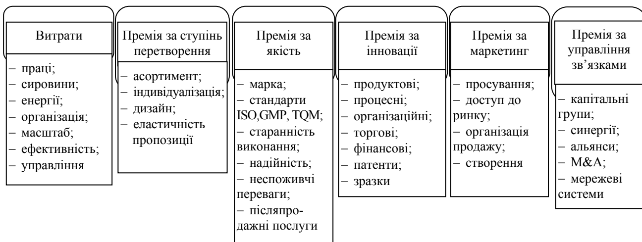
Рис. 1. Джерела конкурентної переваги

Окрім інституцій, можна назвати другу групу відносно “нових” чинників (тобто недавно належним чином оцінених): людський капітал і інноваційність, разом з традиційно вже названою заповзятливістю. Конкурентна здатність країни окрім системних передумов, залежить від широко трактованого людського капіталу, інноваційності і заповзятливості. На сучасному етапі, в період інформаційної революції і розвитку пост-індустріальної економіки, в групі держав OECD ці чинники вирішальні для напрямів розвитку і економічного прогресу [1, с. 550–551]. Це обгрунтовують подані на рис. 1 джерела конкурентних переваг.