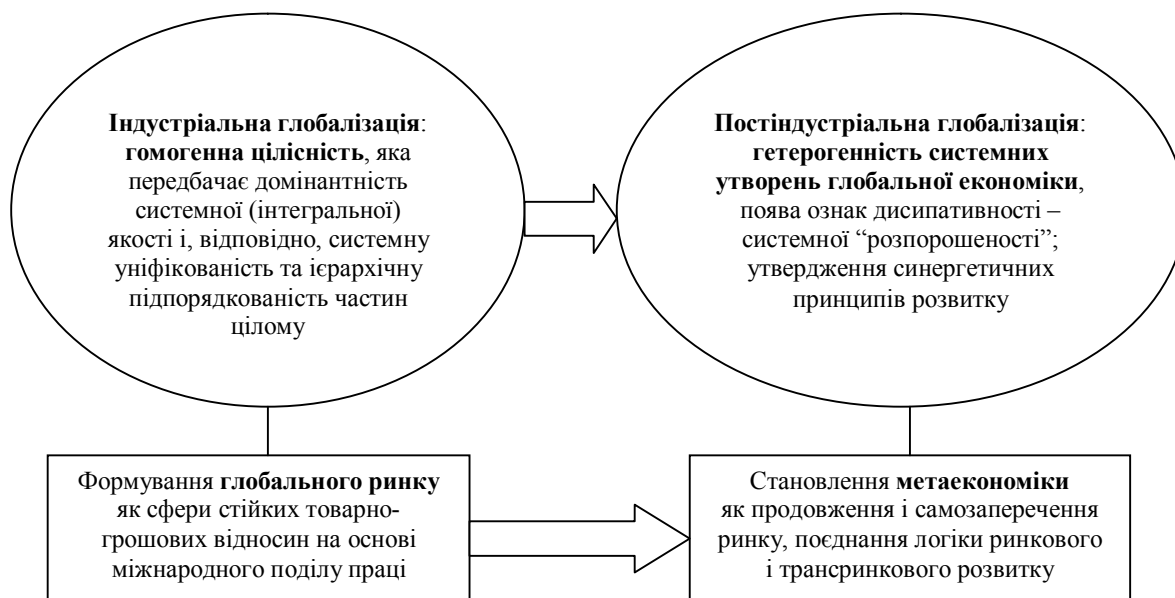
Рис. 1. Логіка трансформаційних процесів у сучасній глобальній економіці

Складні гетерогенні системи – це властивість перехідних трансформаційних процесів. При визначенні узагальнюючих характеристик гетерогенності сучасної глобальної економіки, на думку А. Гальчинського [7], слід керуватися насамперед цим методологічним принципом. Процеси трансформації дають підстави констатувати формування глобального ринку як сфери стійких товарно-грошових відносин на основі міжнародного поділу праці. Означений процес, що характеризується посиленням взаємозв'язку та взаємозалежності суб'єктів та об'єктів ринку, є багатовекторним і комплексним.