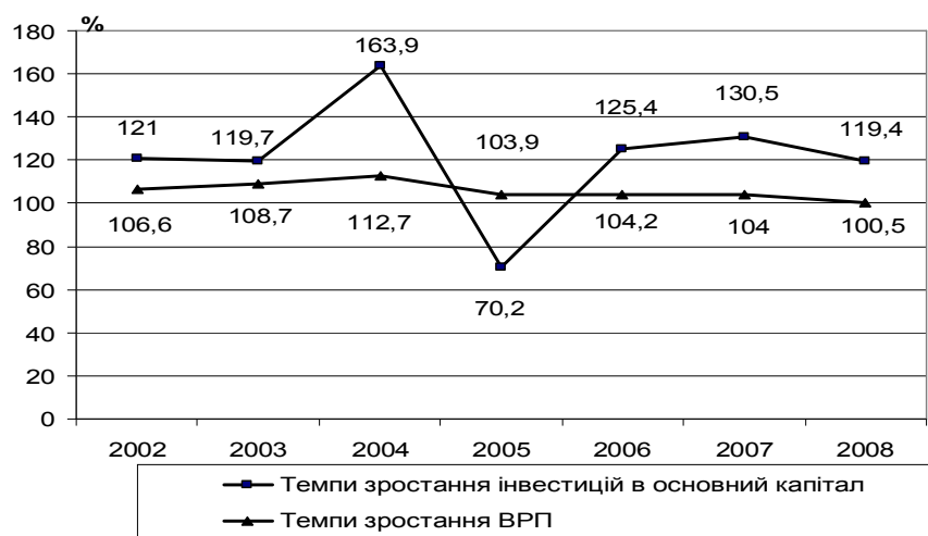
Рис. 2. Темпи зростання інвестицій в основний капітал та валового регіонального продукту (відсоток до попереднього року)

Індекси інвестицій в основний капітал до попереднього року носять нестабільний характер (рис. 2).