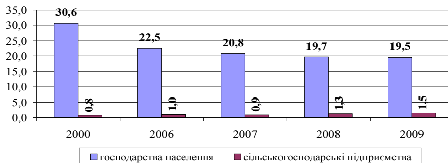
Рис. 4. поголів'я овець і кіз у господарствах Львівської області, тис. голів (на початок року)

Так, наприклад, на початок 2009 року в господарствах населення утримувалось 271,2 тис. голів ВРХ, тоді як в сільськогосподарських підприємствах – 28,5 тис. голів, що в 9,5 разів менше. Ще більша диспропорція