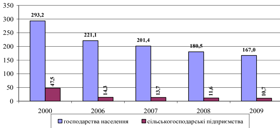
Рис. 2. поголів'я корів у господарствах Львівської області, тис. голів (на початок року)