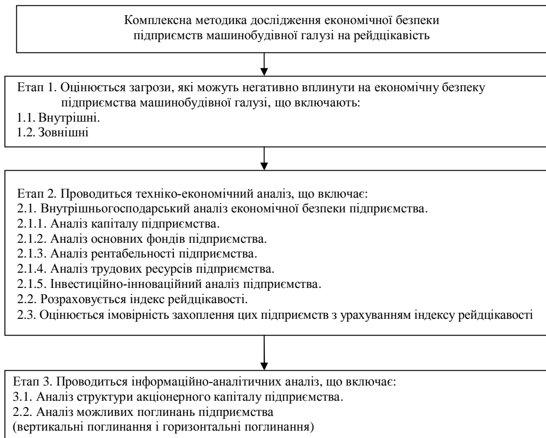
Рис. 2 – Комплексна методика дослідження економічної безпеки підприємства машинобудівної галузі на рейдцікавість

На нашу думку, дослідження економічної безпеки підприємства на рейдцікавість, повинне бути частиною загального аналізу господарської діяльності підприємства. Основні етапи проведення комплексної методики дослідження підприємств машинобудівної галузі на рейдцікавість зображені на рис. 2.