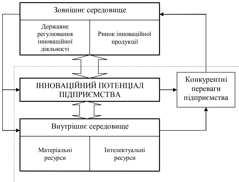
Рис. 1. Оцінка впливу факторів на формування інноваційного потенціалу підприємства як відкритої соціально-економічної системи

Проведене дослідження дозволяє зробити висновок, що інноваційний потенціал підприємства формується під впливом факторів як зовнішнього, так і внутрішнього середовища (рис. 1). Враховуючи, що як продукування, так і впровадження інновацій є важливим джерелом соціально-економічного розвитку підприємств, інноваційний потенціал пропонуємо розглядати крізь призму формування конкурентних переваг підприємства. До факторів зовнішнього середовища віднесено систему державного регулювання інноваційної діяльності та стан ринку інноваційної продукції.