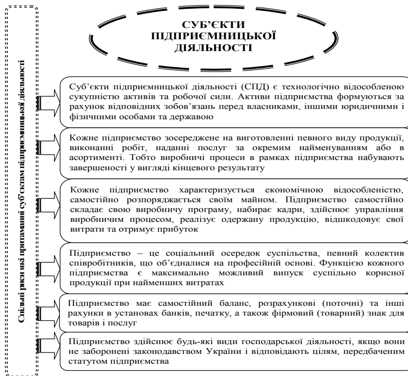
Рис. 1. Спільні риси які притаманні суб'єктам підприємницької діяльності