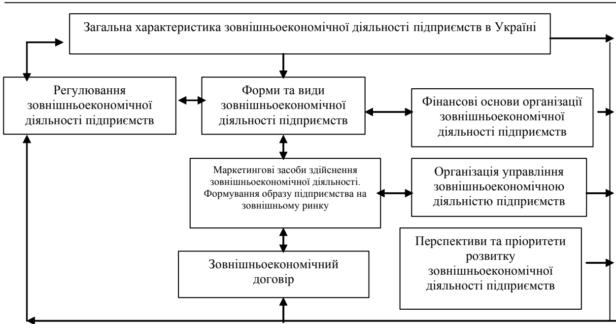
Рис. 1. Системний підхід до аналізу зовнішньоекономічної діяльності