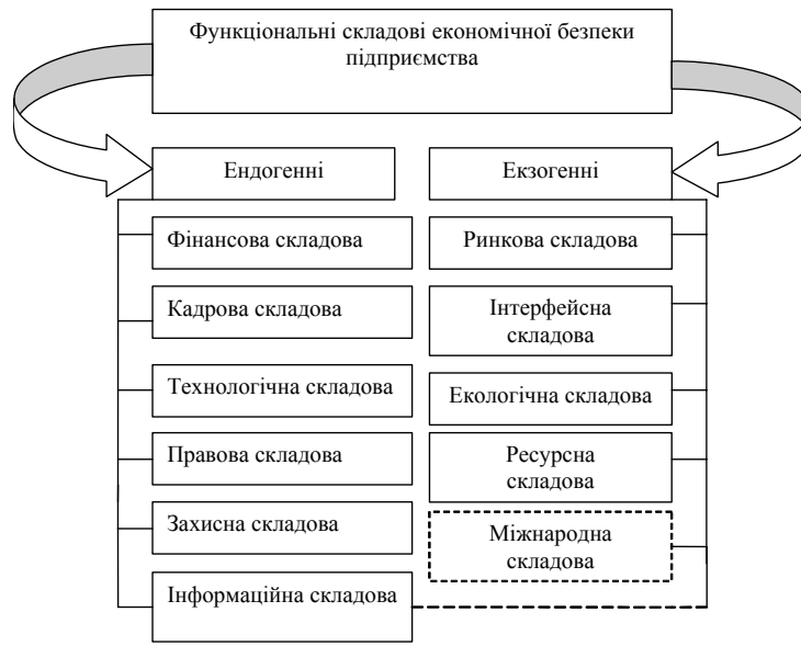
Рис. 3. Загальна структурна схема функціональних складових економічної безпеки підприємства

Таким чином, до ендогенних структурних елементів належать наступні.