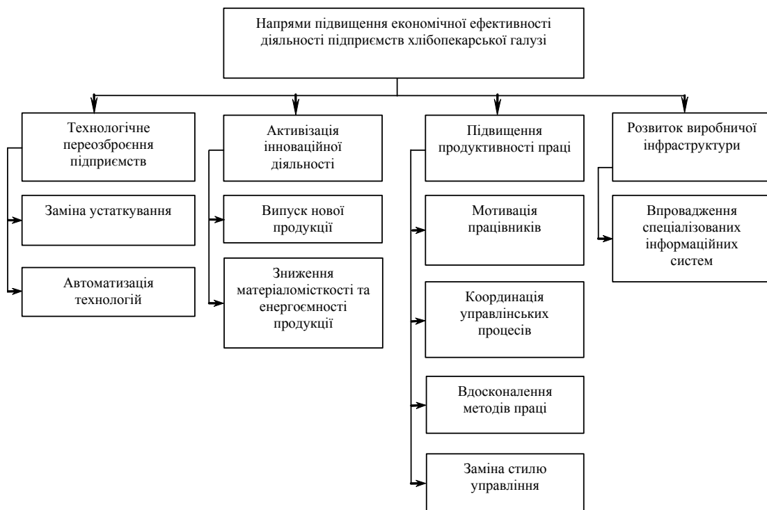
Рис. 2. Напрями підвищення економічної ефективності діяльності підприємств хлібопекарської галузі

Виділимо напрями, які, на нашу думку є актуальними для підвищення економічної ефективності діяльності на рівні підприємств хлібопекарської галузі (рис. 2).