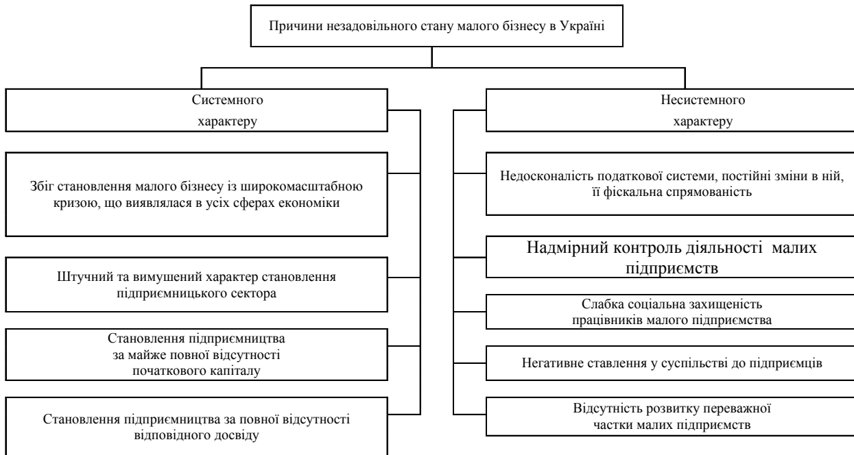
Рис. 2. Причини незадовільного стану малого бізнесу в Україні [10]

неконкурентоспроможність товарів, розвиток бартерних схем розрахунку, гіперінфляція – далеко не повний перелік умов, у яких починалося українське мале підприємництво. Але не зважаючи на складні обставини, нові підприємства в Україні створювалися і в умовах економічного спаду, високої вартості кредитів, відсутності необхідної інфраструктури та високого ризику. До 2007 року кількість малих підприємств в Україні кожного року зростала в середньому майже на 10-13 % (хоч багато з них не працює).