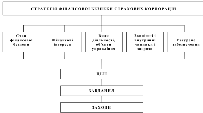
Рис. 1. Елементи стратегії фінансової безпеки страхових корпорацій

досягнення їх цілей, а також керованість процесом виконання корпоративної та ділової стратегій, приймаючи при цьому відчутну участь у розробці і коригуванні останніх, можемо стверджувати, що стратегія забезпечення фінансової безпеки страхових корпорацій також є функціональною стратегією та невід'ємною складовою частиною їх корпоративної стратегії, загалом, та фінансової стратегії, зокрема. Її місце в ієрархії стратегій страхових корпорацій пока-зано на рис. 2.