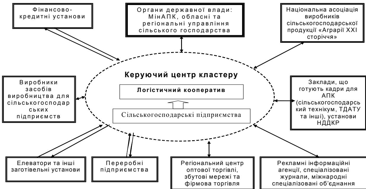
Рис. 2. Організаційна структура маркетингового сільськогосподарського регіонального кластеру

4. Після узгодження кількості та строків продукції формуються кооперативні партії зерна. Важливим аспектом є те, що продукція не переходить до власності кооперативу, а його участь обмежується лише маркетинговою діяльністю: пошуку найбільш вигідних пропозицій щодо купівлі наявних партій, заключення прямих договорів купівлі-продажу, визначення умов політики кондицій.