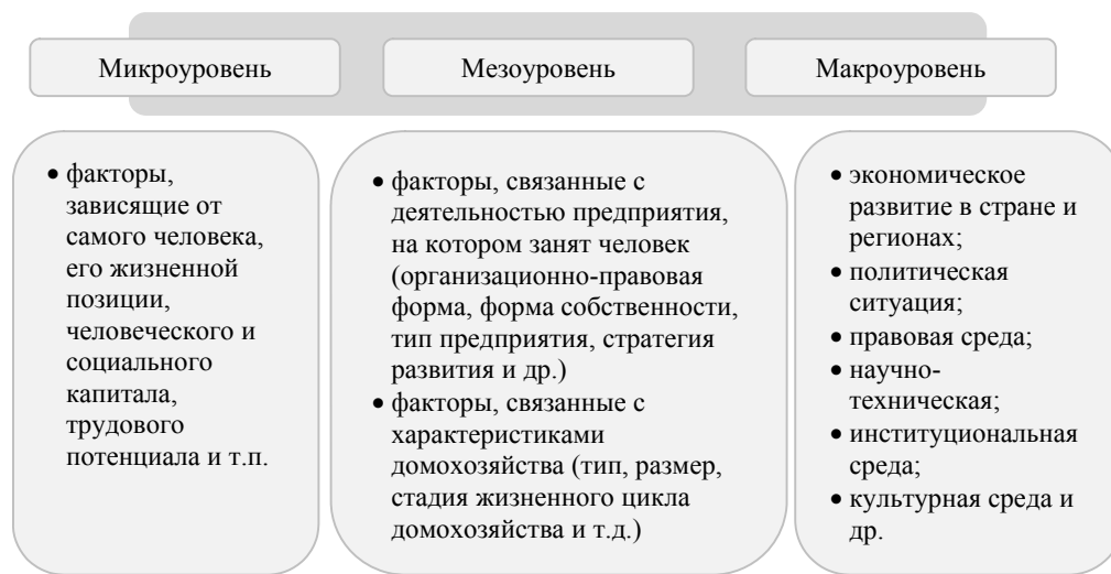
Рис. 1. Класифікація факторів нерівності доходів населення за рівнями управління

• Різниця в спроможностях. У людини різні інтелектуальні, фізичні і естетичні спроможності. Одні успадкували виключальні інтелектуальні спроможності, необхідні для того, щоб отримати достатньо високооплачувану роботу в області медицини, корпоративного управління або права. Інші наділені виключальними фізичними якостями і можуть стати високооплачуваними професійними спортсменами. Тільки небагато з нас мають талант і стають великими артистами або музикантами. Решта ж належать до категорії «звичайних» людини і змушені займатися низкооплачуваними видами діяльності або взагалі не можуть працювати. В цілому спроможності, навички і вміння більшості людини знаходяться на рівні середнього значення.