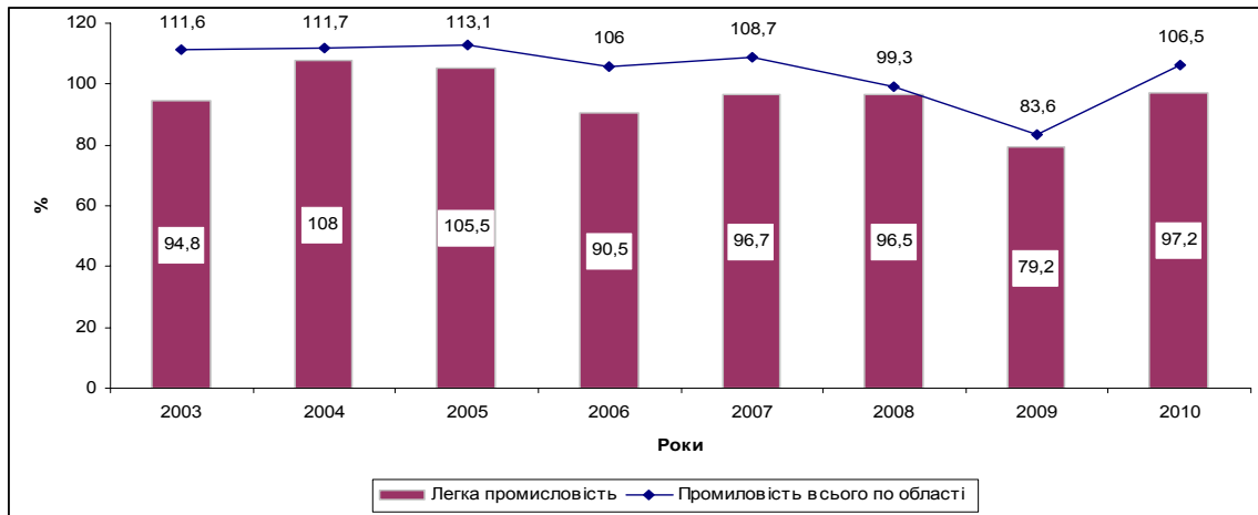
Рис. 2. Індекси промислової продукції у Вінницькій області (відсотків до попереднього року)

Динаміка індексів обсягів виробництва продукції легкої промисловості Вінницької області відображена на рис. 2. У 2010 році, як і в цілому по легкій промисловості України, відмічається зростання обсягів продукції в порівнянні із 2009 р., проте, такий рівень відповідає рівню 2007 р. [3].