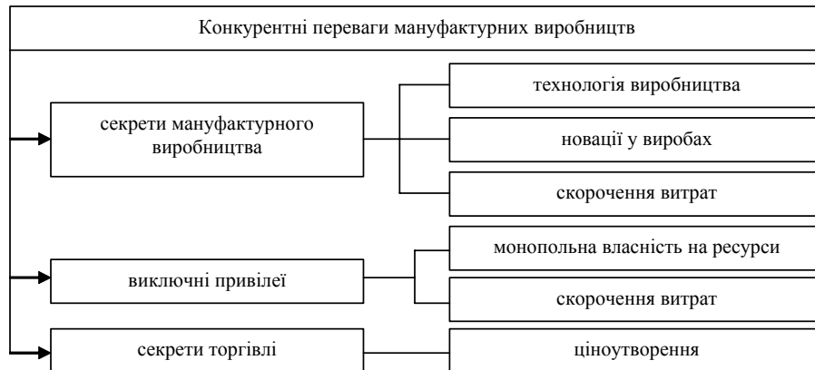
Рис. 1. Конкурентні переваги мануфактурних виробництв за А. Смітом

зберігати досить довго, передаючи їх у спадок своїм нащадкам» [4, с. 182]. Під «секретом» мануфактурного виробництва А. Сміт розуміє конкурентні переваги виробника внаслідок використання ним нової технології виробництва, виготовлення нового, раніше невідомого виробу або ж будь-які інші конкурентні переваги процесу виробництва, зокрема і скорочення матеріальних витрат.