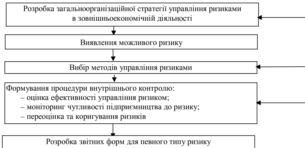
Рис. 1. Алгоритм управління підприємницьким ризиком в умовах зовнішньоекономічної діяльності

Особливістю ризиків міжнародного підприємництва є те, що підприємство повинно враховувати різні середовища діяльності. Будь-яка економічна організація, яка займається зовнішньоекономічною діяльністю з західними чи українськими партнерами неминує зіштовхується з невизначеністю. Підприємства не володіють достатніми (повними) даними про свій теперішній стан і про майбутнє, вони не в стані спрогнозувати всі зміни, які їх очікують на зовнішньому ринку. Планування ризиків дає змогу знизити або підвищити їхній рівень з метою зменшення втрат або отримання додаткових прибутків.