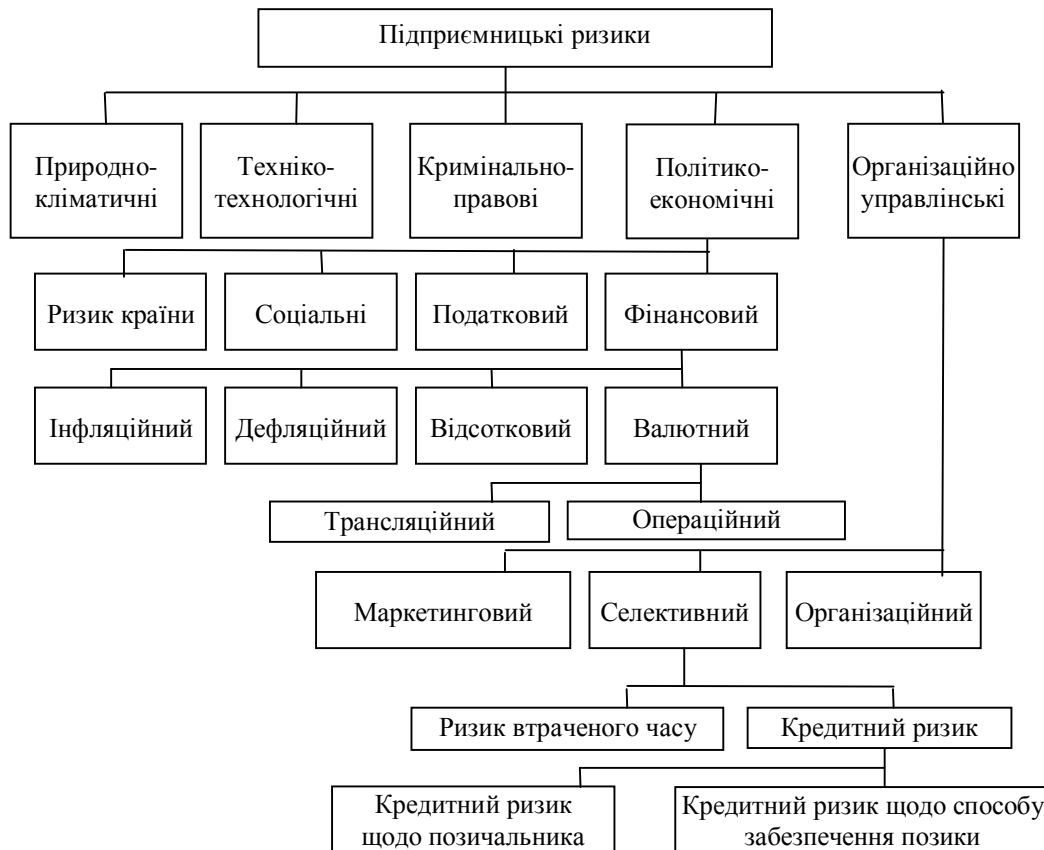
Рис. 3. Схема класифікації підприємницьких ризиків

виду, які через прийняті у класифікації вихідні передумови та припущення не підлягають подальшому поділу. Низка ризиків першого рівня – природно-кліматичні, техніко-технологічні, кримінально-правові, соціальні – вважаються авторами такими, що поки не підлягають подальшому поділу. З урахуванням чотирьох рівнів запропонована схема класифікації підприємницьких ризиків має вигляд (рис. 3).