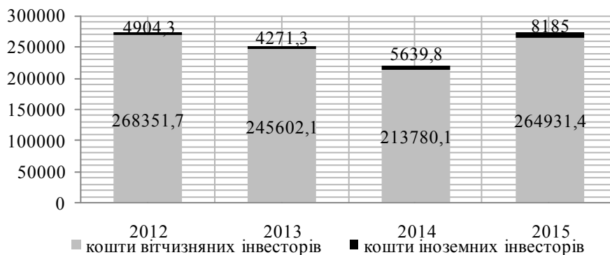
Рис. 1. Іноземні інвестиції в основний капітал підприємств України у загальному обсязі інвестицій протягом 2012–2015 рр., (млн грн.) (сформовано авторами за даними Державної служби статистики України [9])

За статистичними даними з 01.01.2016 по 01.07.2016 в економіку України іноземними інвесторами вкладено 44790,7 млн дол. США прямих іноземних інвестицій (акціонерного капіталу). Основними країнами-інвесторами були Кіпр, Нідерланди, Німеччина, Російська Федерація, Австрія, Велика Британія, Віргінські Острови (Британія), Франція, Швейцарія та Італія (рис. 2).