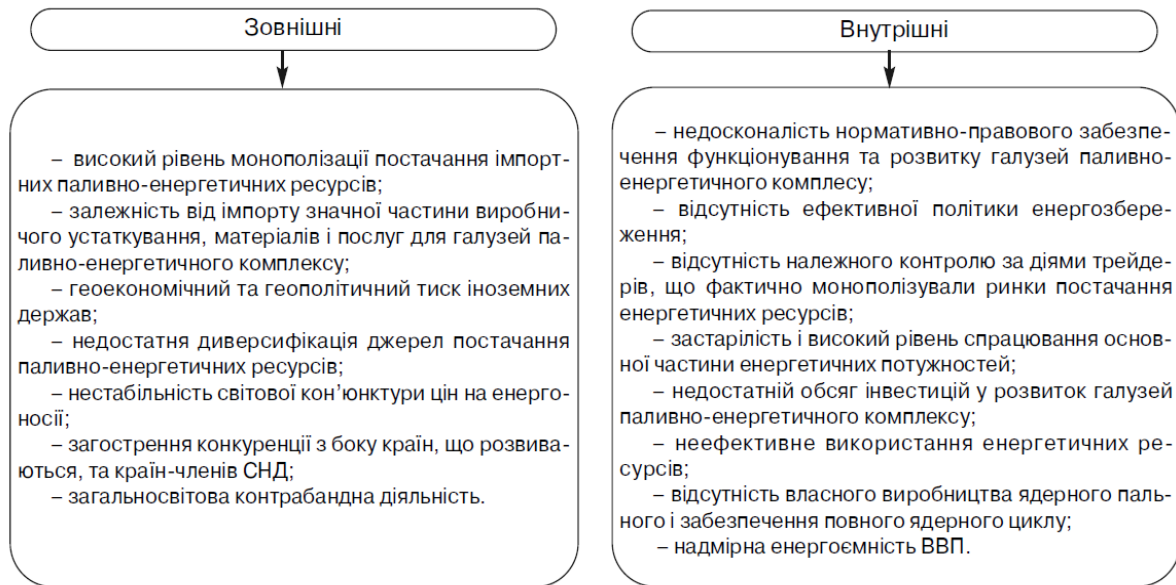
Рис. 2. Основні загрози внутрішньої і зовнішньої енергетичної безпеки України [4]

До соціально-політичних загроз належать нестабільність у суспільстві; негативні соціально-політичні події; приватні інтереси нових власників в енергетиці, що йдуть врозрід із загальними цілями; нездорова конкуренція; протиправні дії влади і керівників підприємств; низька кваліфікація персоналу; криміналізація «енергетичного бізнесу», придбання мафіозними структурами власності та участі у вирішенні енергетичних проблем.