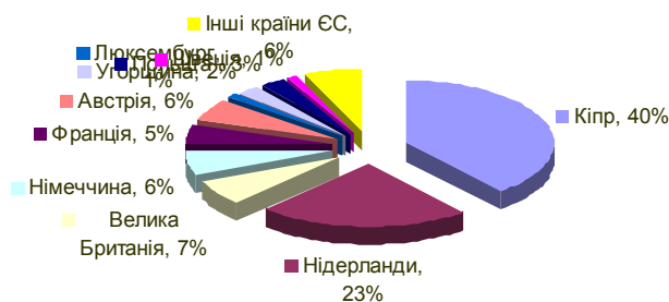
Рис. 2. Обсяг прямих іноземних інвестицій за країнами ЄС у 2016 році, % [7]

Обсяг прямих іноземних інвестицій (акціонерного капіталу) з України в економіку країн світу склав 6315,2 млн дол. США, у т.ч. у країни ЄС – 6111 млн дол. США, що становить 96,77% від загального обсягу українських інвестицій.