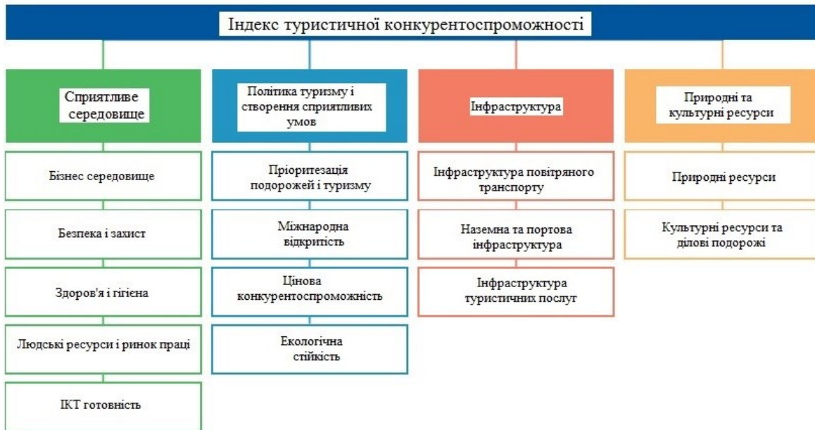
Рис. 1. Складові індексу туристичної конкурентоспроможності

На Рис. 1 наведені складові індексу згідно до їх підпорядкованості [13].