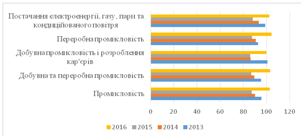
Рис. 1. Індекси промислової продукції за видами діяльності за 2013–2016 роки [5]

Індекси інвестування в промислову продукцію показують, що відбулось зростання у 2016 році порівняно з минулим, за всіма показниками. Особливо значного результату було досягнуто у переробній промисловості у розмірі 104,3%, що є різким зростанням, зважаючи на найбільший спад (87,4%) у 2015 році.