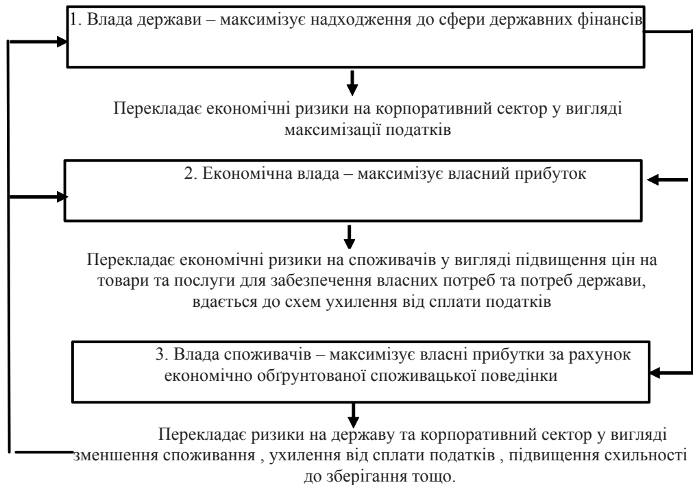
Рис. 2. Максимізація функції корисності суб'єктів економічної влади

Автор цієї роботи вважає, що в сучасних умовах на кожному рівні владної ієрархії функція максимізації корисності реалізується за рахунок дискримінуючих інституційних змін, у процесі чого відбувається розподіл та привласнення економічних ресурсів на умовах нееквівалентного обміну, в наслідку чого відбувається збільшення доходів суб'єктів влади шляхом перекадання ризиків на інших суб'єктів. Максимізація функції корисності схематично може бути наведена таким чином: