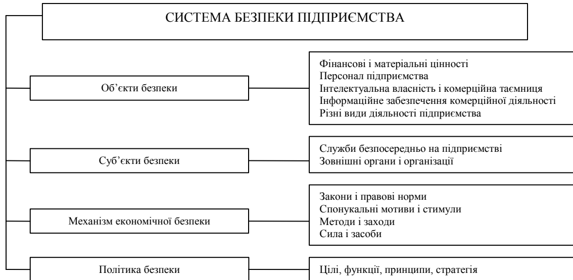
Рис. 1. Елементи системи забезпечення економічної безпеки підприємства

Формування механізму економічної безпеки засноване на визначенні економічних потреб в її забезпеченні, які формуються під впливом об'єктивних і суб'єктивних, внутрішніх і зовнішніх, прогнозованих і непрогнозованих чинників, які в концентрованому вигляді здійснюють деструктивний вплив. Беручи до уваги, що господарський механізм – це свідомо розроблений інструментарій управління, нами розроблена концептуальна схема формування механізму економічної безпеки підприємства, що представлена на рис. 2.