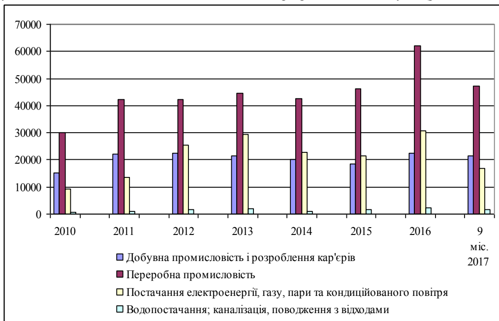
Рис. 1. Динаміка капітальних інвестицій за видами промислової діяльності

Для визначення рівня інвестиційного розвитку вітчизняних промислових підприємств, проаналізуємо на основі таблиці 1 тенденції їх діяльності в розрізі основних галузей (рис. 1, табл. 1) [6].