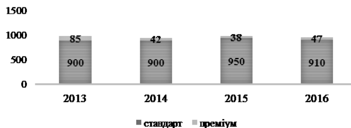
Рис. 2. Динаміка обсягу внутрішнього ринку поліолефінової плівки, т

Потенціал подальшого розвитку сегменту стретч-плівки визначається низьким рівнем показника споживання стретч-плівки на 1 жителя. У 2016 році цей показник в Україні склав 0,66 кг, тоді як в країнах ЄС він складає в середньому 1 кг.