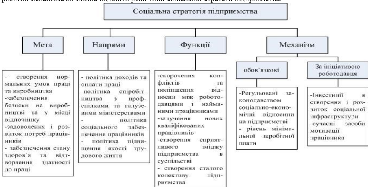
Рис. 2. Елементи соціальної стратегії підприємства (розробка автора)

Можна запропонувати більш коротке визначення, таке як: «соціальна стратегія – це засіб реалізації соціальних цілей підприємства». Можна запропонувати декомпозицію соціальної стратегії на такі складові як: «Мета», «Напрям», «Функції» та «Механізм», що зображено на рис 1. З рис. 1 можна зробити висновок, що мета може реалізовуватися різними варіантами механізму соціальної стратегії. Тому це буде використано для її подальшої деталізації та характеристики. Відповідно за принципом реалізації мети різними механізмами можна виділити різні типи соціальної стратегії підприємства.