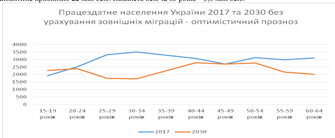
Рис. 3. Динаміка оптимістичного прогнозу на 2030 рік у порівнянні з 2017 роком щодо кількості працездатного населення в Україні

За оптимістичним прогнозом (рис. 3), на 2030 рік кількість працездатного за віком населення становитиме приблизно 22 млн осіб. Кількість осіб за 65 років – 3,6 млн осіб.