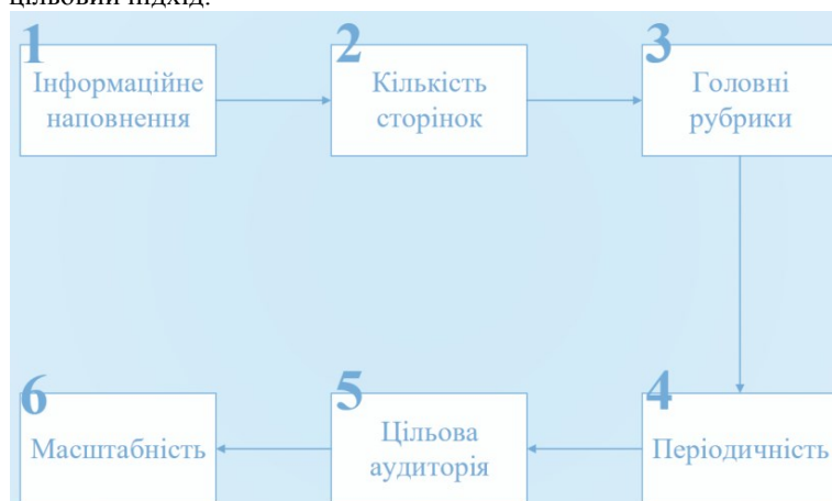
Рис. 2. Схематичне окреслення визначення формату журналу