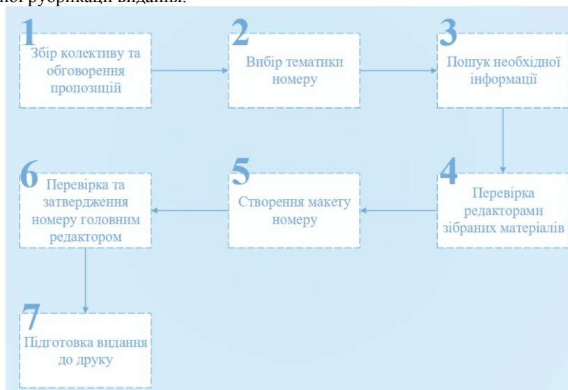
Рис. 3. Структурна модель реалізації випуску студентської періодики

Конкретизація загального вигляду студентського періодичного видання включає в себе модель взаємопов'язаних, але незалежних одне від одного структурних одиниць функціонування (рис. 2). Масштабність видання прямо пропорційно залежить від охоплення читачької аудиторії, на яке у свою чергу впливає періодичність видання [2]. Для того, щоб видання систематично виходило у світ має функціонувати методика тематичної рубрикації видання.