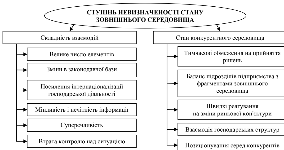
Рис. 2. Причинно-наслідкові зв'язки факторів впливу зовнішнього середовища на виробничу діяльність підприємств

Причинно-наслідкові зв'язки факторів, обумовлюючих виникнення впливу зовнішнього середовища на виробничу діяльність підприємства, представлені на рис. 2.