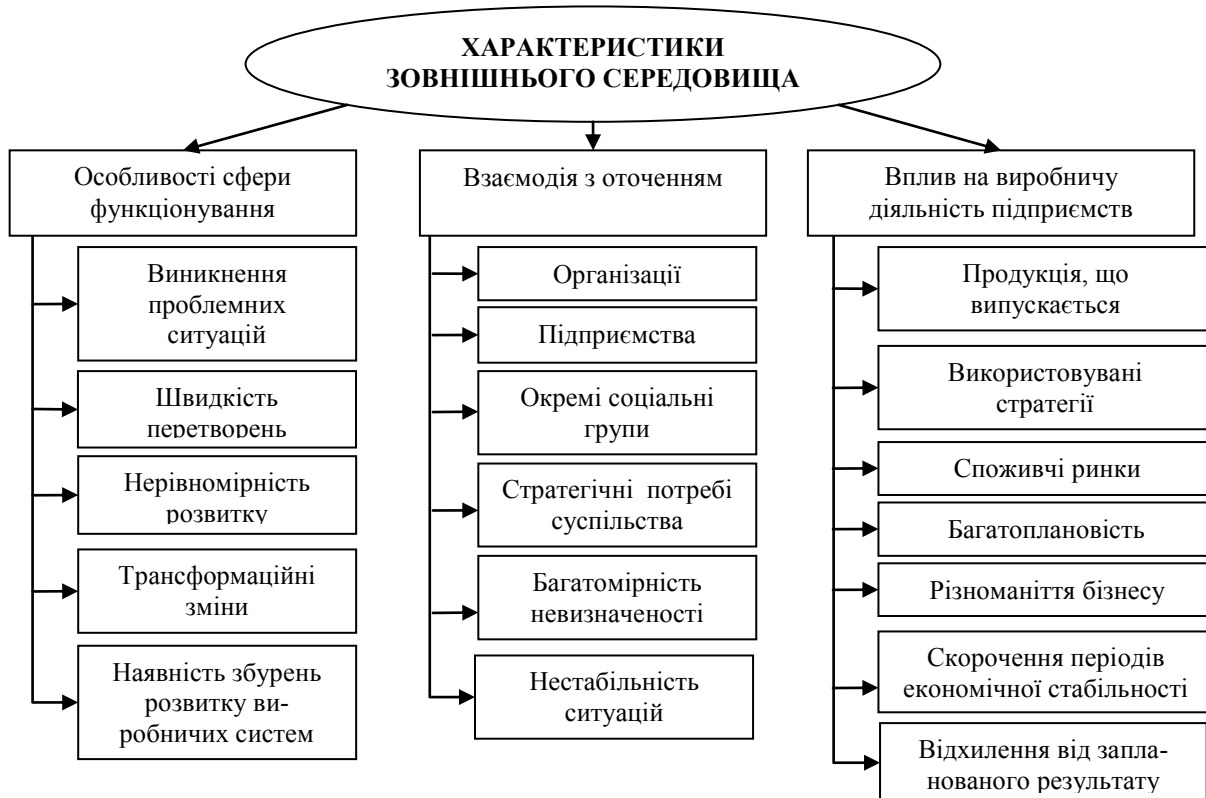
Рис. 1. Змістові характеристики зовнішнього середовища

Змістові характеристики зовнішнього середовища представлені на рис. 1.