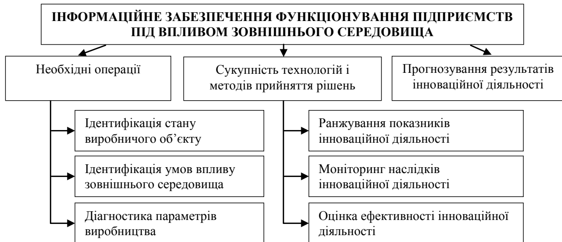
Рис. 3. Інформаційне в забезпечення функціонування підприємств під впливом зовнішнього середовища

Попереджуючі заходи в забезпеченні функціонування підприємств під впливом зовнішнього середовища представлені на рис. 4.