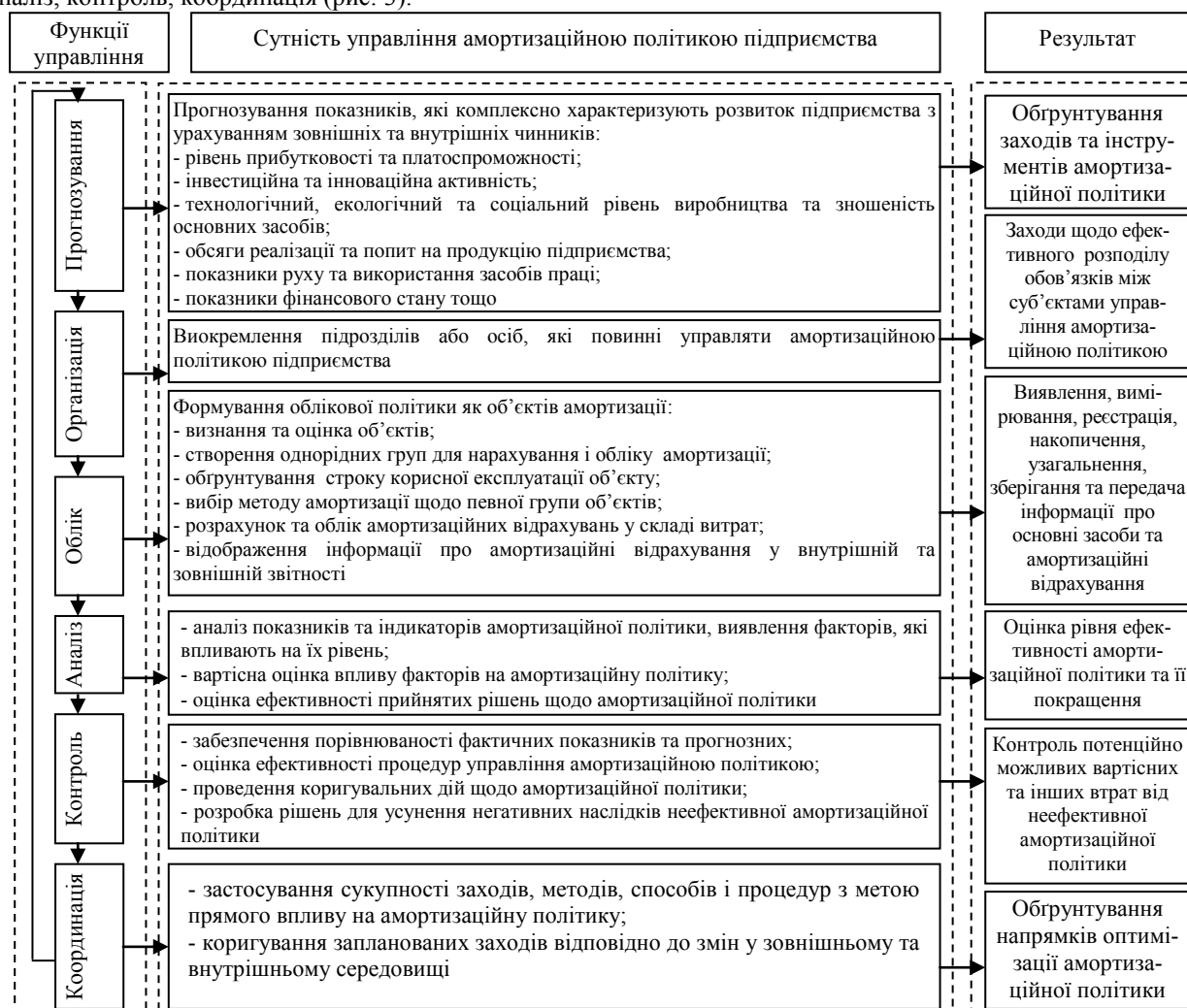
Рис. 3. Функціональна складова організаційно-економічного механізму управління амортизаційною політикою підприємства *

Зазначені підсистеми організаційно-економічного механізму, виконуючи певні функції, доповнюють і накладаються при здійсненні управління, тим самим утворюючи комплексний організаційно-економічний механізм управління амортизаційною політикою підприємства. Тому, виокремлюючи функціональний підхід до побудови такого механізму, вважаємо за доцільне до основних функцій управління саме амортизаційною політикою відносити: планування (прогнозування), організація, облік, аналіз, контроль, координація (рис. 3).