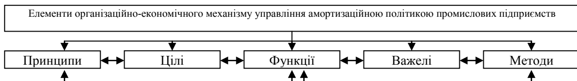
Рис. 1. Вихідні, фундаментальні елементи організаційно-економічного механізму управління амортизаційною політикою підприємства

Авторське бачення елементної ознаки побудови механізму управління амортизаційною політикою підприємства полягає у логічному описі системи управління для забезпечення відтворюваності засобів праці підприємства на новій технологічній основі, прибутковості суб'єкту господарювання у формі фундаментальних елементів: принципів, цілей, функцій, важелів та методів впливу на амортизаційну політику (рис. 1).