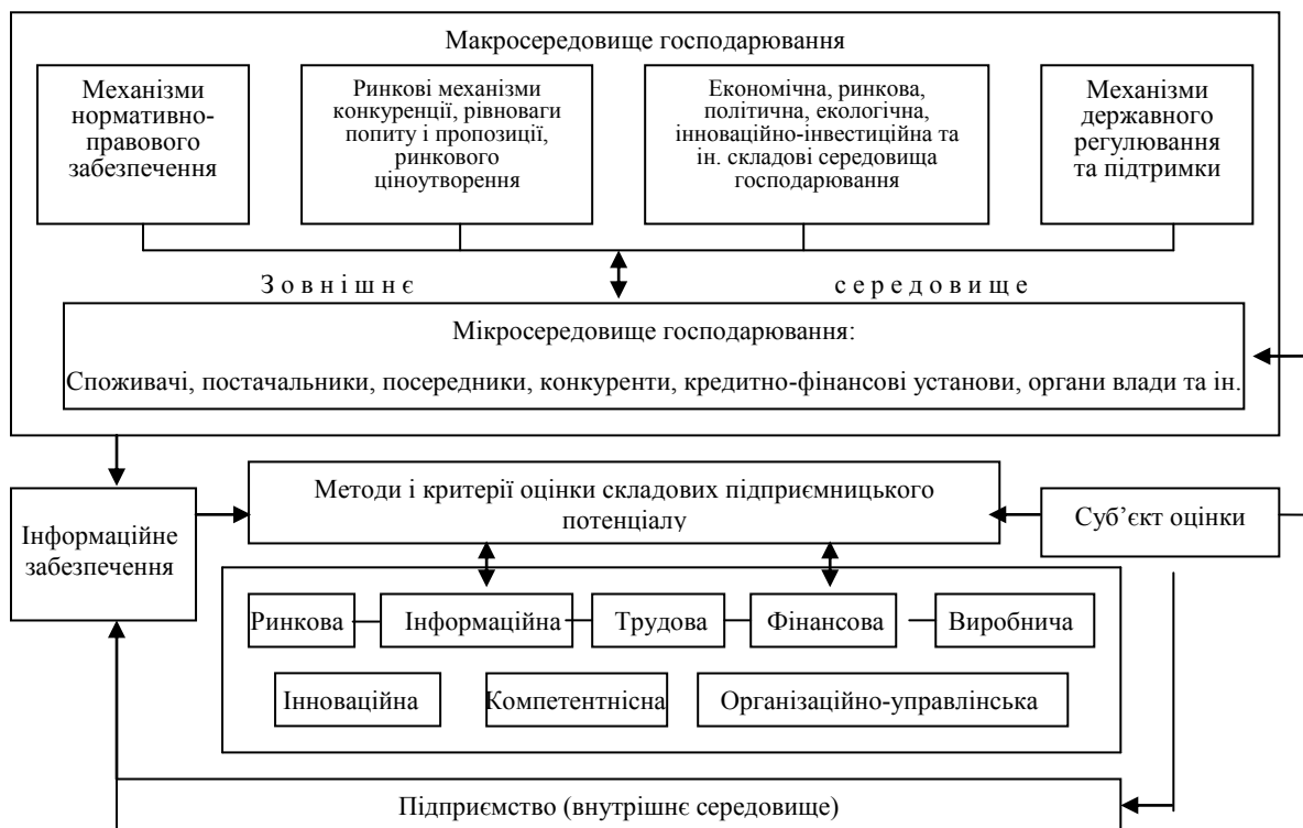
Рис. 3. Структурно-логічна схема оцінювання підприємницького потенціалу підприємства

Оцінку підприємницького потенціалу підприємства потрібно здійснювати із використанням відповідної системи показників, які будуть вибиратись та уточнюватись залежно від особливостей оцінювання. Крім того, критерії оцінки окремих показників для різних підприємств різні залежно від галузі господарства та форми власності підприємства.