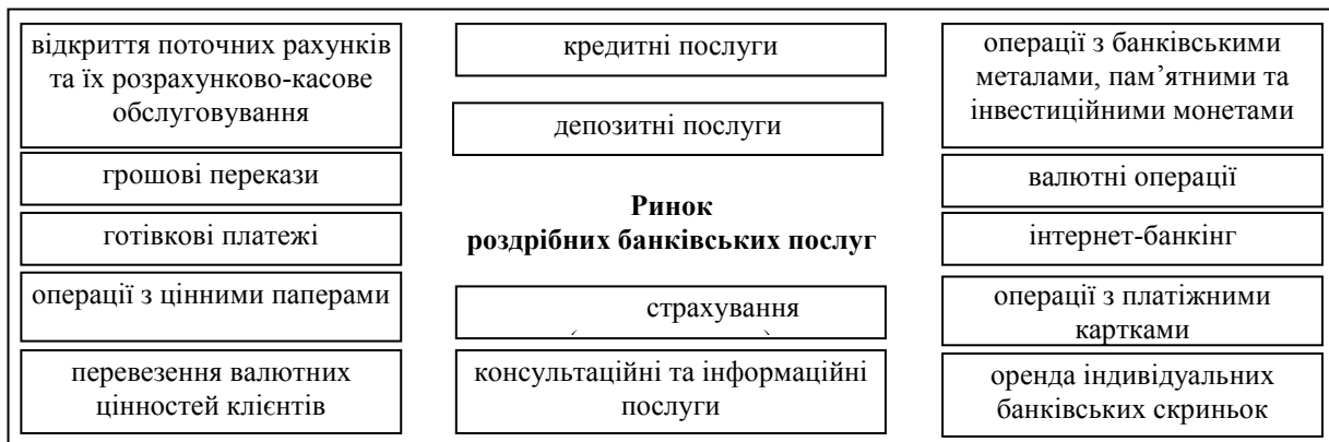
Рис. 1. Ринок роздрібних банківських послуг за видами пропонованих послуг та здійснюваними банківськими операціями*

Банківські установи надають населенню різноманітні послуги шляхом виконання відповідних операцій. Враховуючи практику функціонування банківських установ та вимоги чинного законодавства, можна визначити наступну структуру ринку роздрібних банківських послуг, рис. 1.