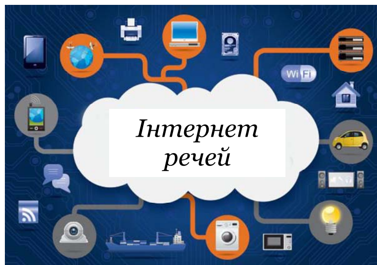
Рис. 1. Суть інтернету речей

Інтернет речей (Internet of Things, IoT) – це міжмережева взаємодія фізичних пристроїв, транспортних засобів (що також називаються "підключеними пристроями", або "розумними пристроями"), будівель й інших предметів, забезпечених електронікою, програмним забезпеченням, датчиками, актуаторами і мережевим підключенням, які дозволяють цим об'єктам збирати і обмінюватися даними. У 2013 році Світова ініціатива стандартизації з Інтернету речей (Global Standards Initiative on Internet of Things, IoT – GSI) визначила інтернет речей як "інфраструктуру інформаційного суспільства". Інтернет речей дозволяє пристроям бути виявленим або контрольованим видалено через існуючу мережеву інфраструктуру, створюючи можливості для прямої інтеграції фізичного світу в комп'ютерну систему, в результаті підвищуючи ефективність, точність, економічну вигоду на додаток до скорочення втручання людини. Коли інтернет речей доповнюється датчиками і виконавчими механізмами, ця технологія стає базою для загальніших кіберфізичних систем, які також охоплюють такі технології, як розумні мережі, розумні будинки, розумний транспорт і розумні міста. Кожна річ унікально ідентифікується через вбудовану обчислювальну систему, але здатна взаємодіяти з існуючою інфраструктурою інтернету. За оцінками експертів, до 2020 року в інтернет речей буде включено майже 50 мільярдів об'єктів [1].