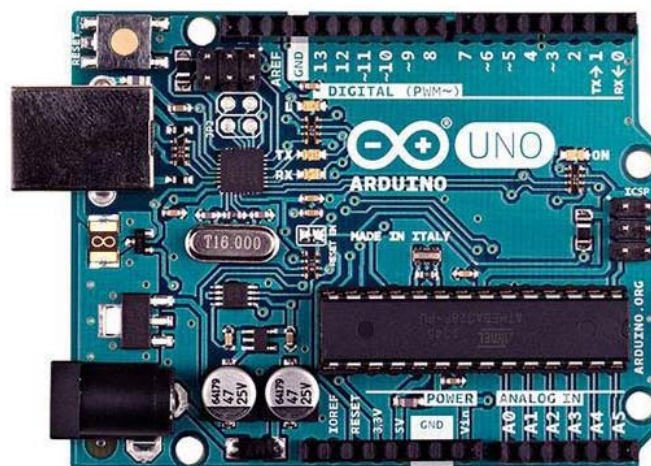
Рис. 2. Контролер Arduino Uno R3

Наприклад, застосування мережевих додатків зараз не викликає складнощів, оскільки доступні готові платформи швидкої розробки користувацьких проєктів. Наприклад, в якості контролера буде використаний контролер з сімейства Arduino.