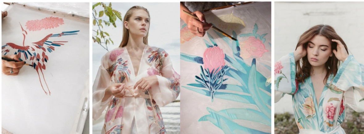
Рис. 4. Фрагменти авторських принтів бренду NYMPH DRESSES та виробів з їх використанням

Протягом останніх декількох років в світі почали виникати бренди, які працюють виключно з таким видом оздоблення. Використання цього виду дає можливість молодому бренду створити сучасний та оригінальний одяг. Наприклад, український бренд NYMPH DRESSES займається виготовленням одягу з авторським розписом і акцентує увагу саме на ньому. У NYMPH не буває індивідуального пошиву без розпису – це не ательє, а бренд одягу, який створюється винятково з тканин, розписаних вручну (рис. 4). Також є варіант створення унікального виробу з ексклюзивним малюнком [9].