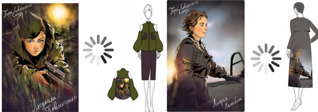
Рис. 6. Трансформації творчого джерела

При дизайн-проектванні авторської колекції одягу з використанням власних принтів творчим джерелом обрано пін-ап малюнки – портрети жінок військових [11]. Трансформація джерела натхнення відбувається з огляду на його виокремлені, переосмислені та розвинуті характеристики, після чого обирається спосіб їх перенесення на об'єкт дизайн-проектвання, який зміг би максимально відобразити сутність та художнє значення образу колекції. Трансформацію творчого джерела представлено на рис. 6.