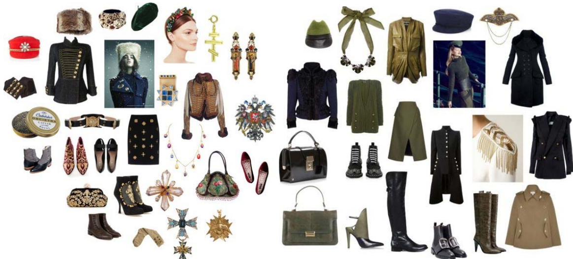
Рис. 1. Стилізація виробів з ознаками стилю «мілітарі»

З військової форми в жіночий костюм увійшли шинелі, пальта з накладними кишенями, акцентовані застібки, аксесуари, комір-стояк, авіатор, взуття, яке має незначну схожість з військовими берцями. Популярність у світовій моді цей стильовий напрям отримав в 1980-і роки, коли Крістіан Діор і Луї Віттон представили світу свої перші колекції одягу в стилі «мілітарі». Завдяки творчому підходу талановиті дизайнери змогли бруталній військовій формі надати жіночності і вишуканості [3]. Стилізовані вироби, які можна віднести до стилю «мілітарі», представлено на рис. 1.