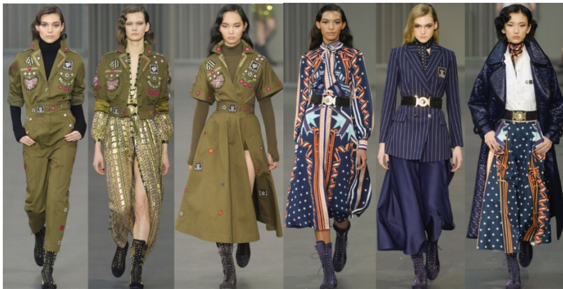
Рис. 3. Фрагменти колекції Temperley London в стилі «мілітарі» сезону осінь-зима 2018-2019 рр.

Вся увага на декоративні деталі – це один з ключових моментів «мілітарі» в колекції Temperley London. Знаючи про привабливість військової форми, дизайнер Еліс Темперлі знову включається в гру зі стилем «мілітарі» [5], але цього разу велику увагу приділяє саме оздобленню (рис. 3).