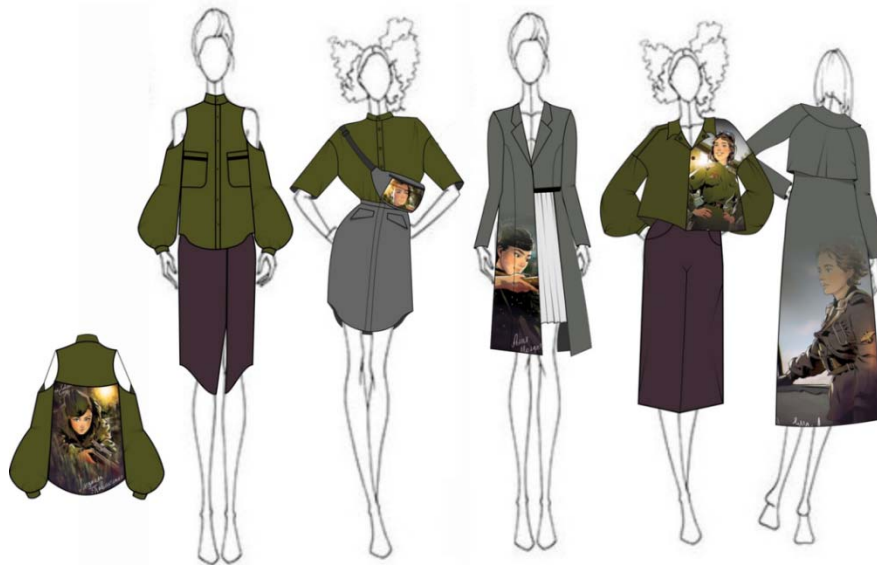
Рис. 7. Художні ескізи моделей одягу колекції «НЕЗЛАМНА»

здумом та використаними матеріалами, однак, мають різну конструктивну основу. Також проєктовані вироби доповнюють один одного та становлять художню цілісність, утворюючи неповторний ансамбль. Колекція жіночого одягу в стилі «мілітарі» складається з комплектів, які містять блузки, спідниці, штани, сукню, куртку та тренч. Вироби гармонійно поєднанні між собою у комплекти за допомогою гармонійного поєднання кольорів та трендового виду оздоблення – авторський ручний розпис.