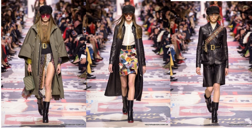
Рис. 2. Фрагменти колекції Dior «Червоний травень» осінь-зима 2018-2019рр.

Стиль «мілітарі» добре прослідковується в останніх колекціях від Christian Dior та Temperley London [4, 5]. Представлена колекція на Тижні моди в Парижі сезону осінь-зима 2018-2019 від Марії Грації Кьюрі натхненна естетикою 60-х. Завдяки декоратору Олександрю де Бетаку модний показ перетворився в повномасштабне шоу, що відсилає до травневих подій у Франції 1968 року [4]. Комплекти колекції в яких чітко прослідковується стиль «мілітарі» представлено на рис. 2.