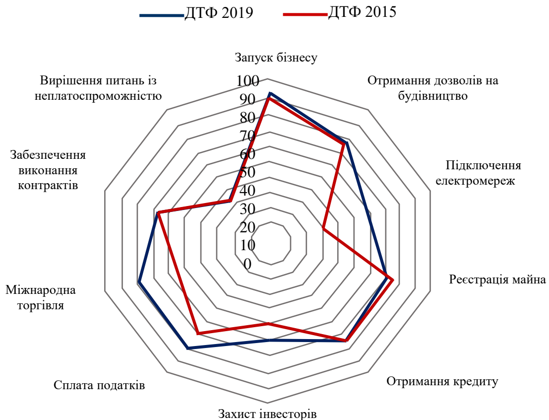
Рис. 3. Показник індексу Doing Bussiness України [17]

Більш реальні зміни, відносний прогрес країни ілюструє індекс легкості введення бізнесу (Doing Bussiness), що складається на основі опитувань 13800 міжнародних експертів юридичних, інвестиційних, аудиторських компаній, до 72 осіб з однієї країни.