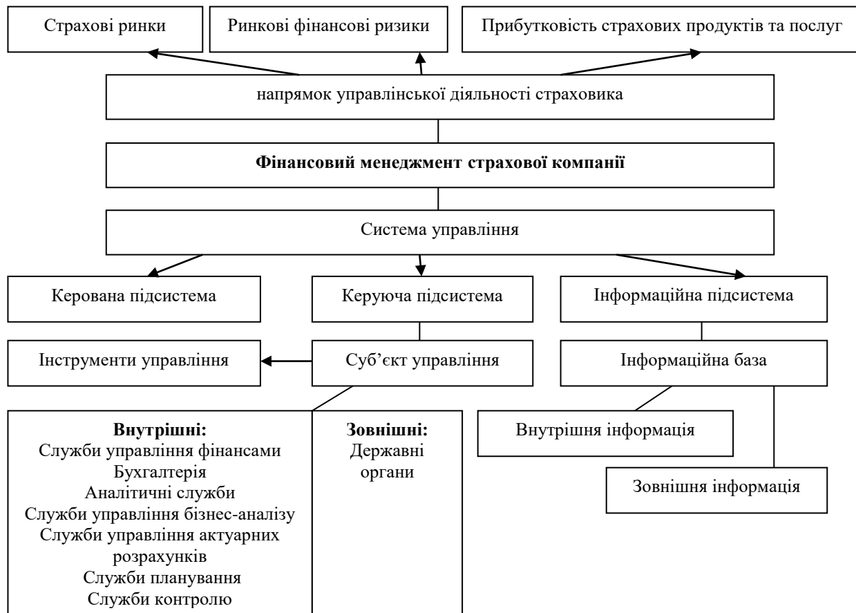
Рис. 1. Сутність та елементи фінансового менеджменту страхової компанії (складено на основі [1– 6 та ін.]

пов'язані з страховими ринками, його фінансовими ризиками, прибутковістю та ефективністю використання окремих видів страхових продуктів та послуг. Він включає управлінську діяльність, пов'язану з визначенням потреб у фінансових ресурсах, виявленням всіх альтернативних джерел фінансування та їх оцінкою; практичним одержанням фінансових ресурсів та ефективним їх використанням.