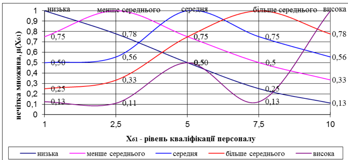
Рис. 2. Функція належності для рівня кваліфікації персоналу

Виконана формалізація та ієрархічна класифікація факторів, які впливають на оцінку інвестиційної привабливості промислового підприємства, дозволяє побудувати функції належності нечітких оцінок впливу факторів. Ці функції будуть використані при моделюванні інтелектуальної підтримки прийняття управлінського рішення щодо вибору об'єкта інвестування після проведення оцінки інвестиційної привабливості. На рис. 2 наведена функція належності для рівня кваліфікації персоналу ( x_{61} ).